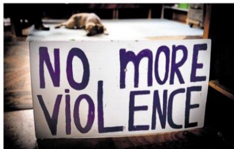
Een van de bordes voor de vredesdemonstraties met op de achtergrond hond Amok.

“ Waaron hoor je nou niks over hoe je een oorlog oplost?”